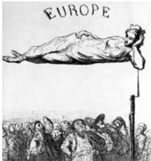
Eine meisterhafte Darstellung des französischen Karikaturisten Honoré Daumiers (1866): Das politische Gleichgewicht in Europa – nur noch gestützt auf Bajonette.

terland nicht im Stich.“ Die Internationale zerbrach, und in Deutschland spaltete sich die Partei in Befürworter (MSPD) und Gegner (USPD) der „Burgfriedenspolitik“. Obwohl beide offiziell am traditionellen Internationalismus festhielten, war die MSPD als Preis für innenpolitische Reformen bereit, gemäßigte Kriegszielforderungen zu tolerieren. Die Gegensätze zwischen Mehrheit und Opposition [Dok. 4] spiegelten sich auch in den unterschiedlichen Auffassungen zur „Mitteleuropa-Idee“ wieder. Faktisch war es der rechte Flügel der USPD um Eduard Bernstein, Karl Kautsky, Rudolf Breitscheid und Rudolf Hilferding, der bereits während des Weltkriegs die außen-