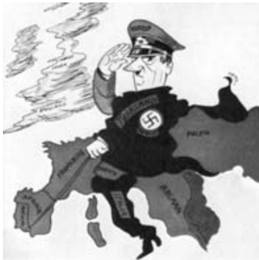
Die Nazis zerstörten nicht nur Deutschland, sondern verwüsteten ganz Europa. Der Traum eines demokratischen, sozialen und geeinten Europas blieb in der Sozialdemokratie dennoch wach – im Untergrund und im Exil. (Eine vorausschauende Karikatur aus Norwegen – 1939)

3. Die Nazis zerstörten zuerst die Demokratie und verwüsteten dann Europa in deutschem Namen. Nach dem SPD-Verbot im Dritten Reich leisteten viele Parteimitglieder Widerstand oder flohen ins Exil.