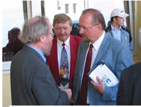
Bundestagspräsident Wolfgang Thierse als Gast in Bochum