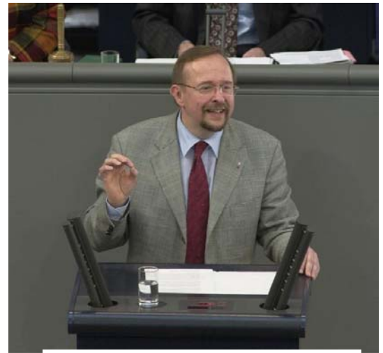
Die erste Rede im Deutschen Bundestag am 13. März 2003